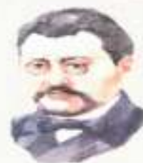
Ахмет Байтұрсынұлы - ұлт ұстазы